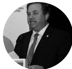
Monsieur Jacques Demers

Dans le point de presse tenu le 28 mars 2019, le président de la Fédération québécoise des municipalités et président d'honneur du Forum, Monsieur Jacques Demers, a souligné l'implication accrue du monde municipal dans les questions touchant l'immigration et l'importance de partager les meilleures pratiques entre tous les partenaires et les acteurs impliqués pour bâtir une régionalisation forte et pérenne. Bien que dans le contexte de la rareté de la main-d'œuvre actuelle le développement économique territorial soit au cœur du débat, M. Demers a rappelé l'importance du virage également humain de la régionalisation. Les 1108 municipalités locales qui font partie d'une municipalité régionale de comté (MRC) doivent devenir propices à l'accompagnement des personnes immigrantes dans tous les aspects de leur établissement régional. Par ailleurs, et en tant que gouvernements de proximité, les municipalités disposent de fonds importants de développement des territoires dont l'investissement visent à soutenir la mise en valeur et la promotion des régions du Québec. Pour M. Demers, les régions du Québec sont génératrices d'emploi et d'investissement et leur dynamisme est entretenu par les ressources locales qui assurent des prises en charge importantes pour l'établissement régional des personnes immigrantes.