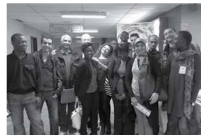
↑ Participants au séjour exploratoire à Sherbrooke dans le cadre de la foire Emploi Diversité