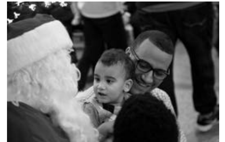
↑↓ Fête de Noël organisée en collaboration avec les divers services