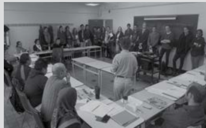
↑ Visite des élèves du collège Jean-de-Brébeuf à l'un des cours de français de PROMIS