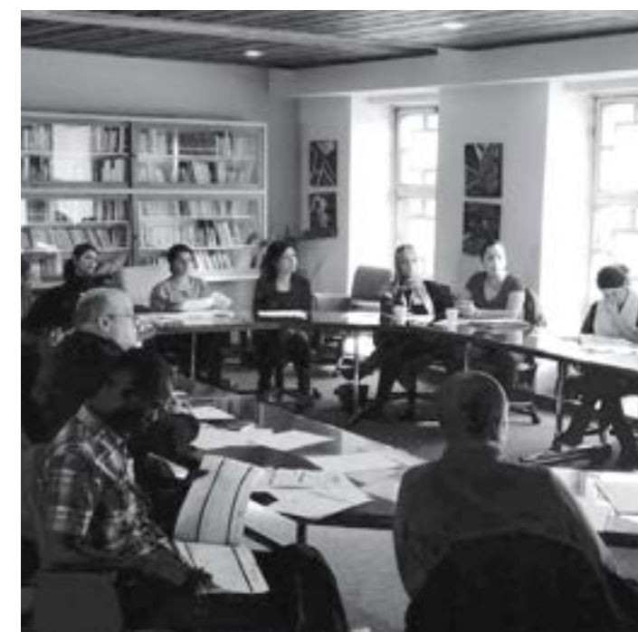
↑ Séance d'information sur les régions du Québec : l'Estrie