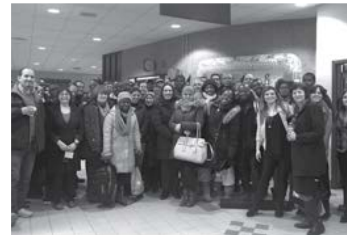
↑ Participants au séjour exploratoire dans les Laurentides