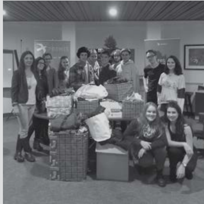
↑ Don de vêtement par les élèves du collège Jean-de-Brébeuf 2015