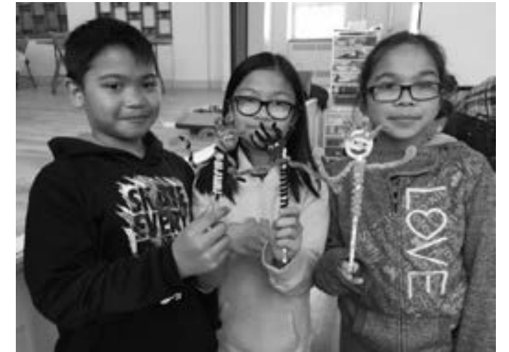
↑ Atelier de bricolage du soutien scolaire