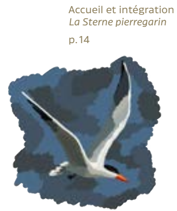
Accueil et intégration La Sterne pierregarin p. 14