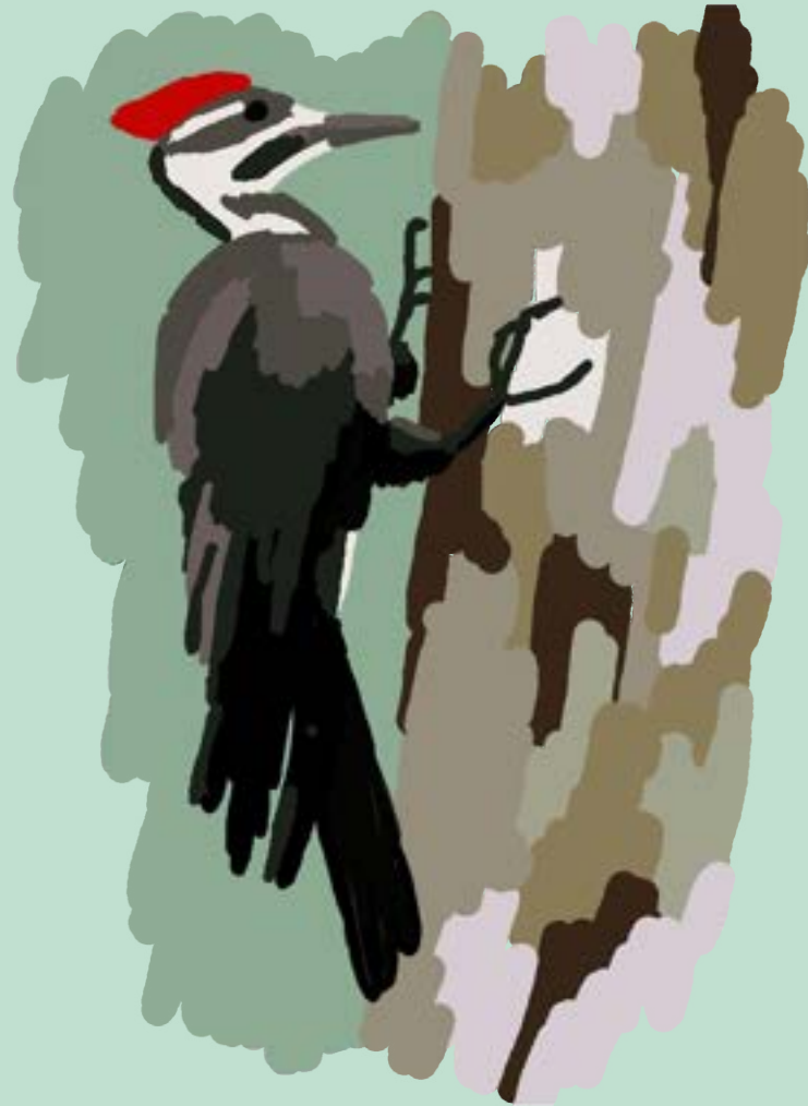
Le Grand Pic Amérique du Nord

On reconnaît le Grand Pic au son distinctif de son bec perçant l'écorce des arbres à la recherche d'insectes. Son travail acharné joue un rôle important dans l'écosystème de la forêt. Son nid, qu'il creuse dans le tronc d'arbres morts, est abandonné à chaque année et de nombreuses espèces – notamment les hiboux, certains canards et quelques petits mammifères – comptent sur ces demeures pour s'abriter.