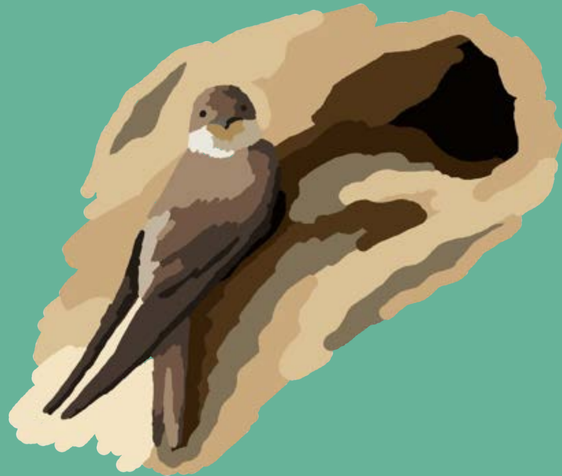
L'Hirondelle de rivage Amériques, Afrique, Asie, Europe

Les Hirondelles de rivage vivent en colonie dans des nids creusés à même le flanc d'une carrière ou d'une falaise de sable. Leurs demeures sont aménagées dans une cavité située au bout d'un tunnel d'environ 60 cm de profondeur. Bien qu'ils parcourent jusqu'à 10 000 km, les hirondelles sont des oiseaux migrateurs qui retrouvent le lieu où ils nichaient l'année précédente.