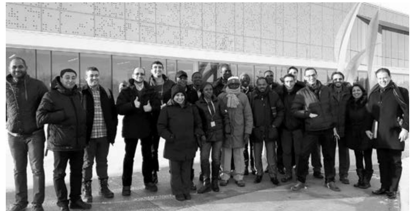
↑ Séjour exploratoire à Drummondville : visite de l'entreprise SOPREMA CANADA à l'hiver 2017

Accompagne la clientèle qui désire démarrer une entreprise en région.