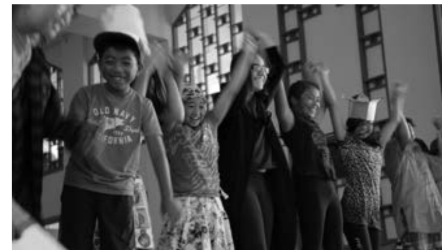
↑ Gala du camp de jour de PROMIS

Autres activités: Sorties au Cap Saint-Jacques, Mont-Royal, Jardin botanique, Château Ramzey.