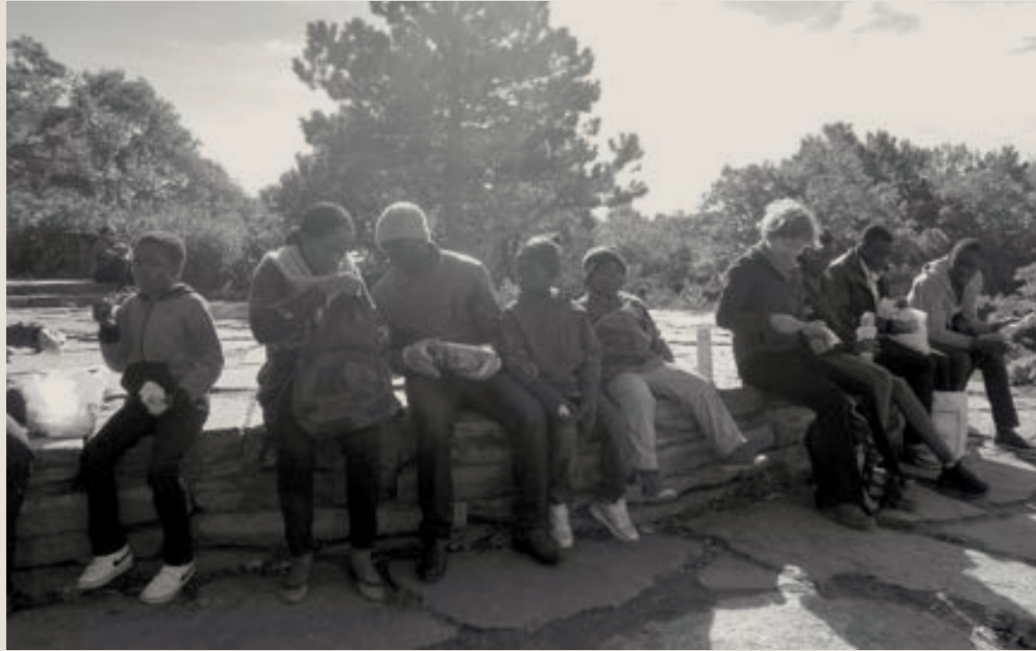
↑ Randonnée sous les feuilles d'automne - Service du Soutien aux familles