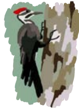
Aide à l'emploi Le Grand Pic p. 18