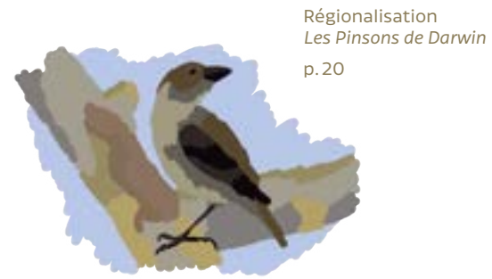
Régionalisation Les Pinsons de Darwin p. 20