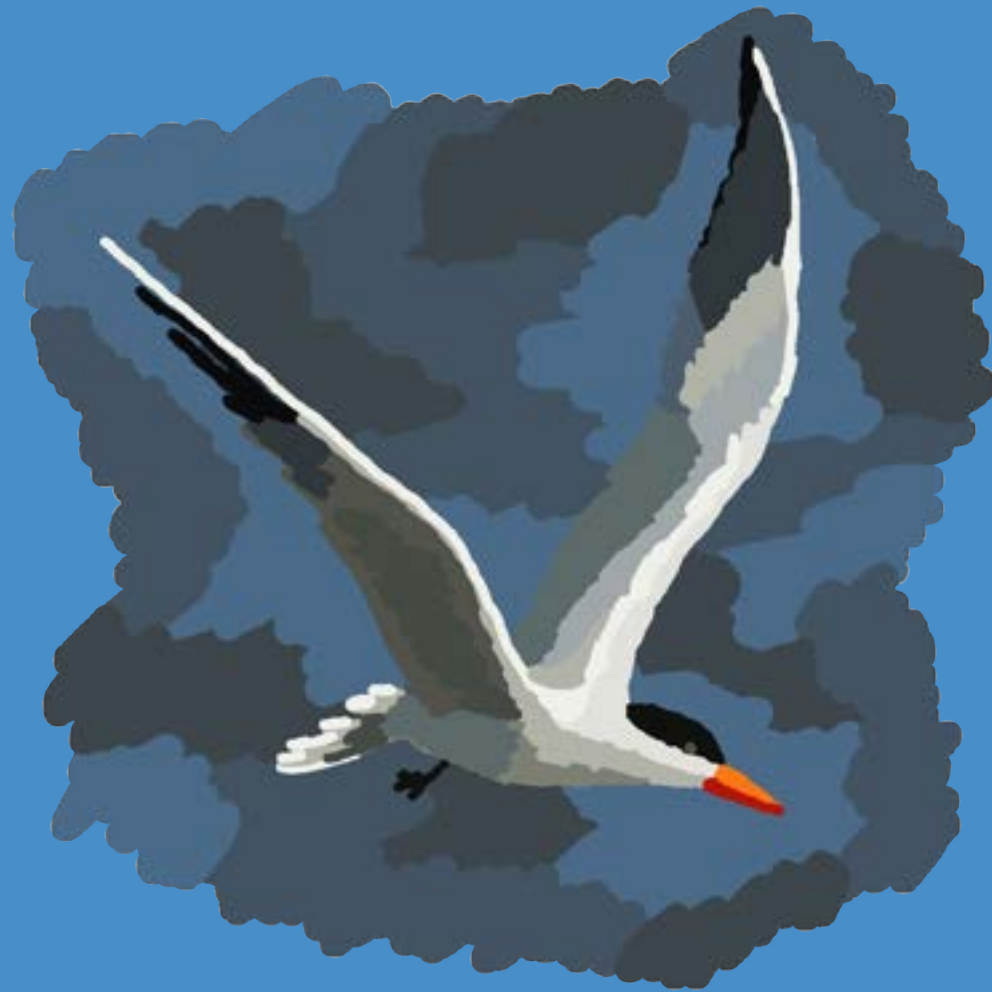
La Sterne pierregarin Europe, Asie et Amérique du Nord

La Sterne pierregarin est un oiseau grégaire vivant en zone côtière. Celle que l'on nomme aussi goélette accueille les marins en leur signalant l'arrivée imminente de la terre ferme. La Sterne pierregarin hiverne sur les rives du golfe du Mexique et du sud de la Floride, jusqu'en Amérique centrale. Au début de chaque printemps, les colonies reviennent occuper leurs aires de nidification de l'hémisphère Nord.