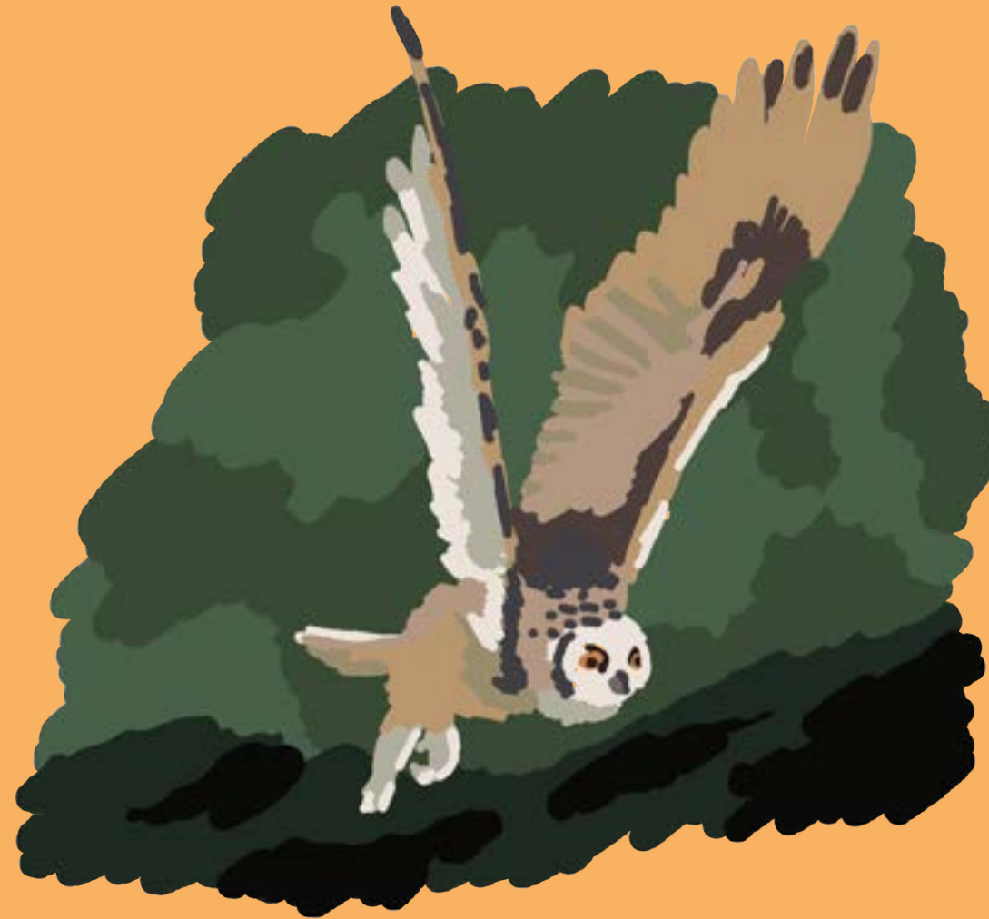
Le Grand-duc Amériques

Sous une apparence stoïque, camouflé au creux d'un arbre, le Grand-duc observe et analyse son environnement à travers ses larges yeux jaunes. Ces derniers sont parmi les plus grands, toutes proportions gardées, au sein de l'ensemble des vertébrés terrestres. En plus de posséder une acuité visuelle d'exception, sa tête peut effectuer une rotation de 270 degrés, ce qui lui procure un vaste champ de vision.