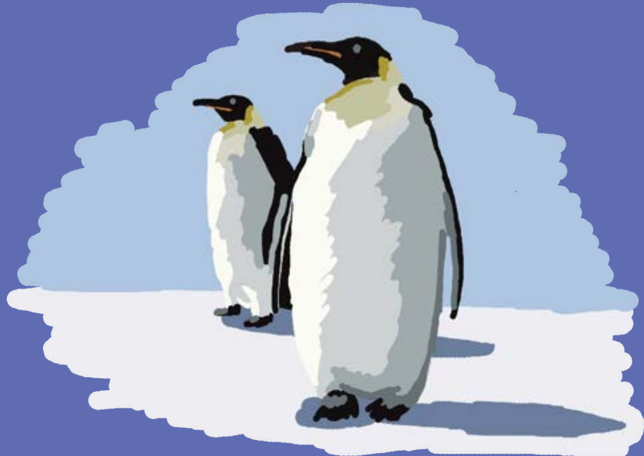
Le Manchot empereur Antarctique

Le Manchot empereur vit en colonies sur les terres hostiles de l'Antarctique. Lors de blizzard, les individus se regroupent en un amas compact leur permettant de se protéger des froids extrêmes. En plus de ce comportement spécifique, le Manchot empereur possède un registre complexe de cris nécessaires à la reconnaissance des parents entre eux et des adultes avec leur petit. Ces appels sonores permettent aux membres d'une famille de se localiser à travers des dizaines de milliers d'individus.