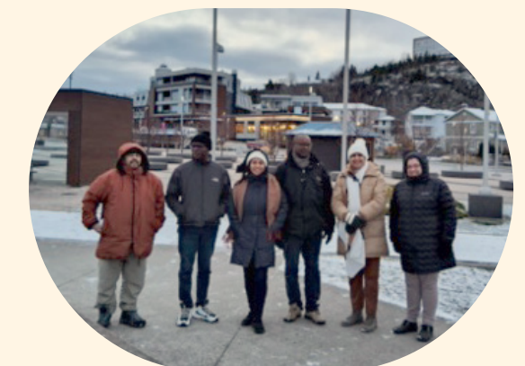
Séjour exploratoire au Saguenay

Accompagne la clientèle qui désire démarrer une entreprise en région.