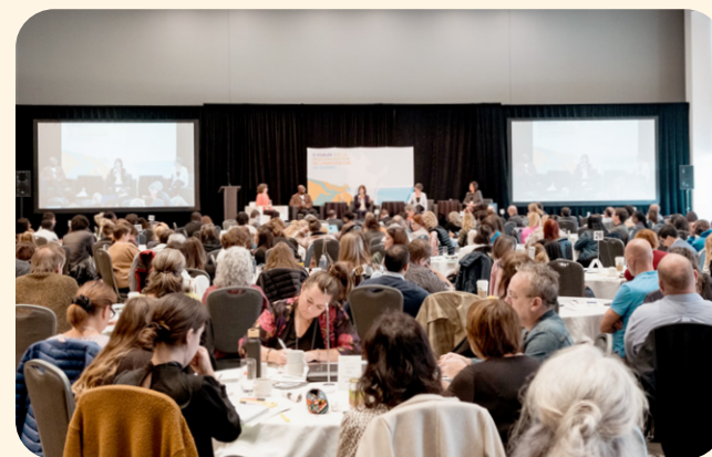
Aperçu du 2 e Forum national sur la régionalisation de l'immigration au Québec

Nous avons continué le travail de déploiement du projet Emplois en régions tout au long de l'année et nous avons réalisé le 2 e Forum sur la régionalisation de l'immigration à Trois-Rivières, les 29 et 30 septembre 2022, avec la participation de 305 représentants d'organismes provenant des 15 régions administratives ciblées pour la régionalisation.